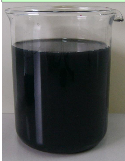
処理前ブース用水